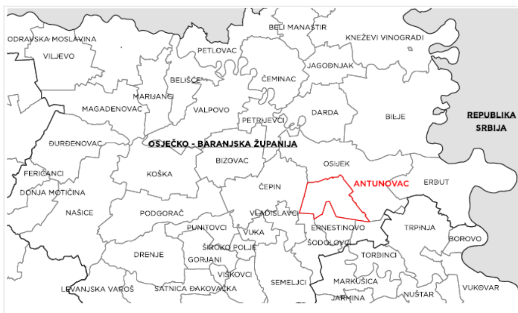
Položaj Općine Antunovac u Osječko-baranjskoj županiji

Prostor Općine Antunovac dio je šireg prostora na krajnjem istočnom dijelu Republike Hrvatske, odnosno njegove prirodno-geografske cjeline Istočne Hrvatske. Nalazi se na manjem jugoistočnom dijelu Osječko-baranjske županije te obuhvaća udjel od 1,4% ukupnog županijskog teritorija. Površina Općine Antunovac iznosi 57,26 km 2 .